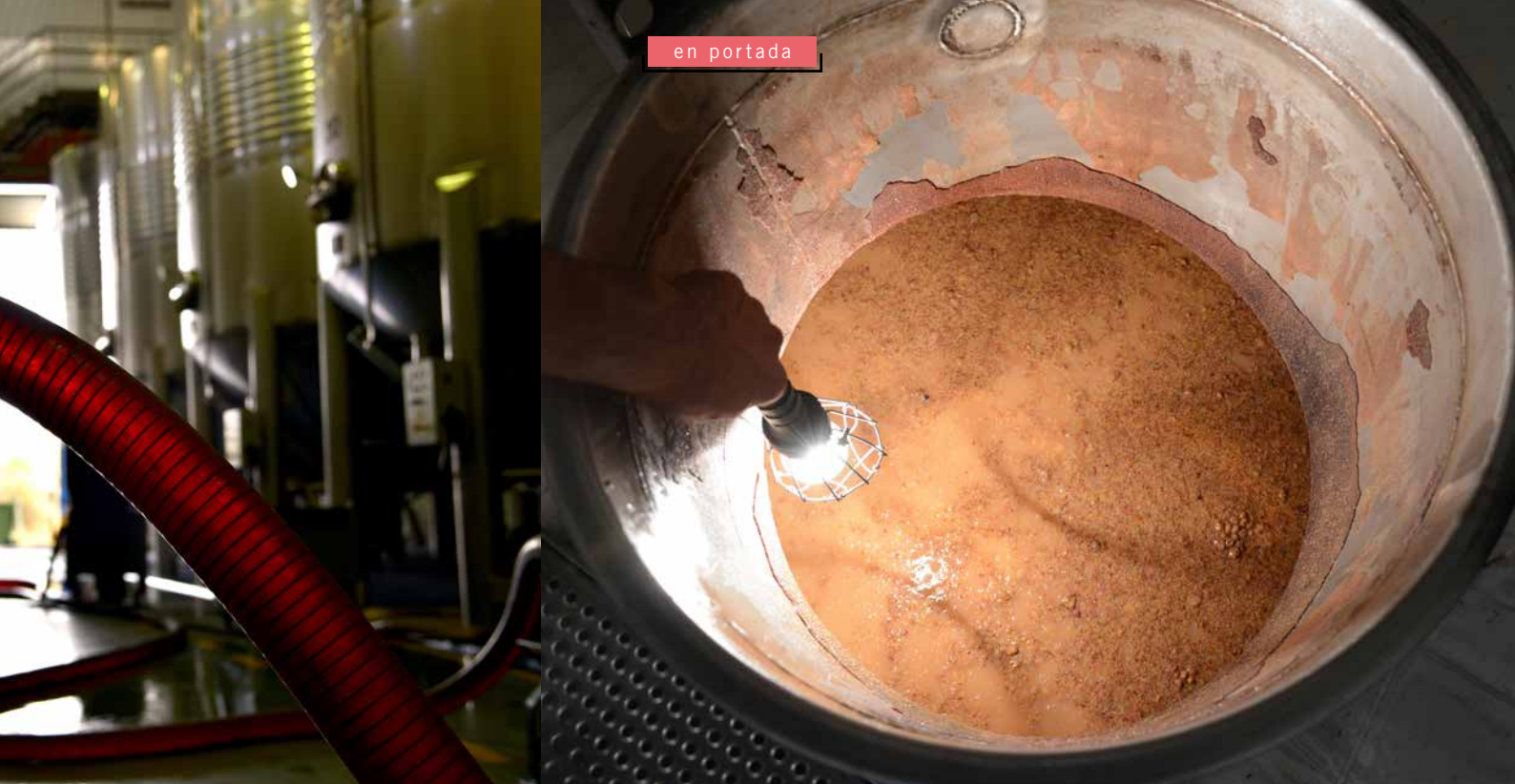
Proceso de fermentación, donde se aprecia el color pálido del clarete.

que el mosto limpio se deposite en la parte inferior del depósito. Tan limpio queda el mosto que es preciso, al trasegar el vino a otro depósito para hacer la fermentación, incorporar un poco de turbio para que las levaduras se desarrollen bien y no haya problemas con la fermentación. “Son vinos muy exigentes en la entrada de la uva en la bodega porque requieren hacer este proceso muy rápido. En apenas 48 horas el mosto ya está fermentando”, aclara el enólogo.