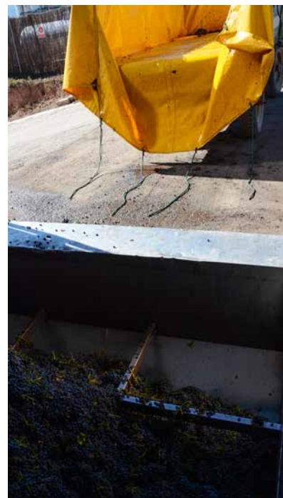
La Garnacha se recoge pronto para elaborar el clarete.